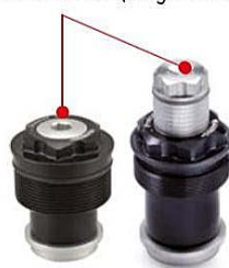
Preload unit (range: 15 mm)