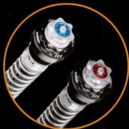
SEALED FORK CARTRIDGE KIT F25SA