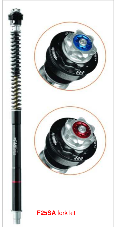
F25SA fork kit