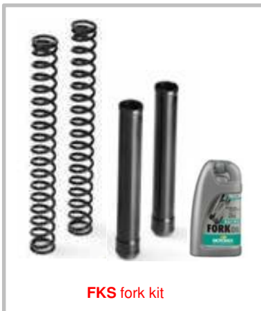
FKS fork kit