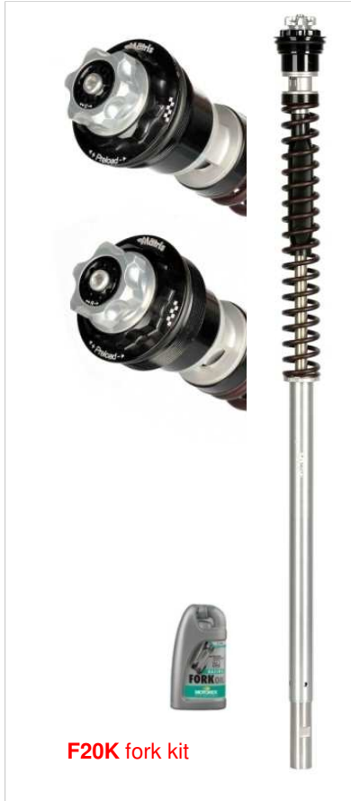
F20K fork kit