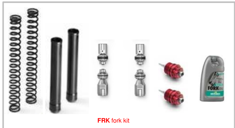
FRK fork kit

CH = HighSpeed Comp. adj. / regolazione Compressione AV CL = LowSpeed Comp. adj. / regolazione Compressione BV C = compression adj. / regolazione Compressione R = rebound adj. / regolazione Estensione L = length adj. / regolazione Interasse P = std spring preload / precarico molla std HP = hydraulic spring preload adj. / precarico molla idraulico.